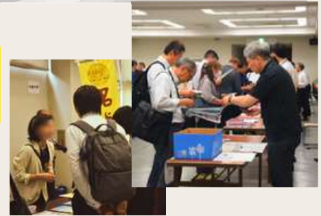
過去の交流会の様子