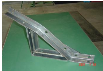
1 級 検 定 作 品 の 例

構造物製作に係わる技術知識及び技能を習得し、併せて国家資格技能士1級および2級習得を目指した下記講座を開設します。興味のある方は、資格習得を目指し、奮って参加挑戦して下さい。